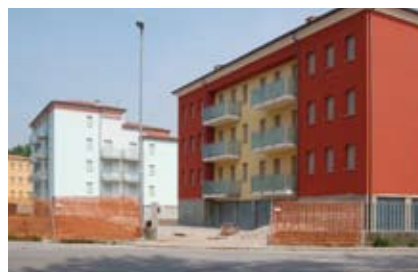
Palazzina B (sx) e C (dx)