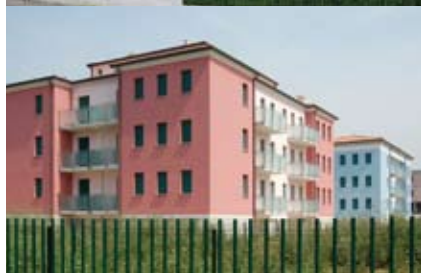
Palazzina D (sx) e G (dx)